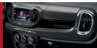
609 Grigio Moda