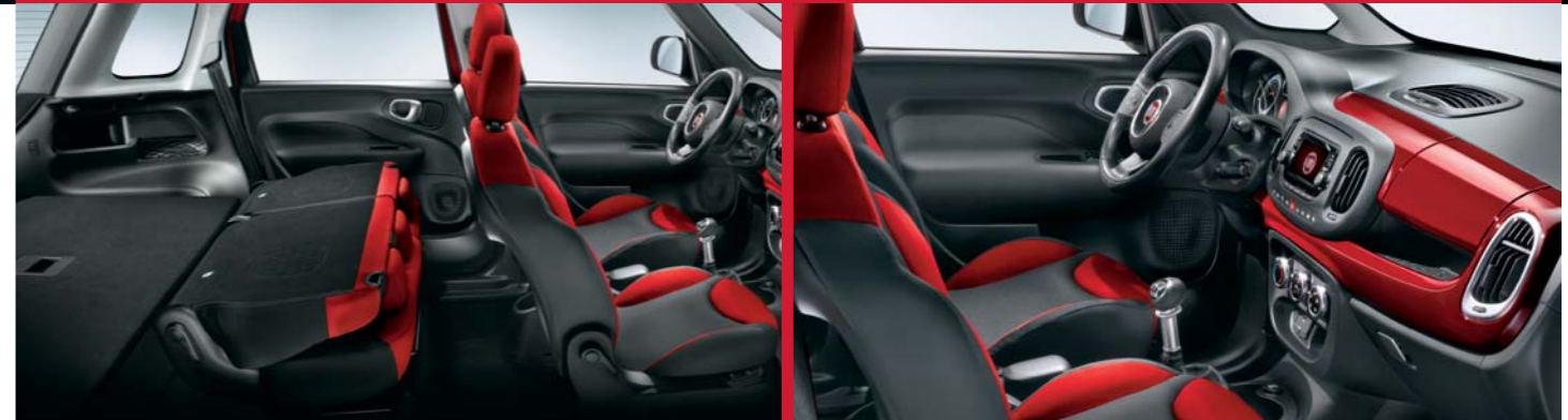
Abbattendo i sedili posteriori si ottiene un ampio e regolare spazio di carico che può arrivare a 1310 dm 3 .

500L PRO è generosa di spazio, di comfort, di praticità, perché tutto è studiato per ottenere il massimo rendimento con il minimo sforzo. La plancia ergonomica, dispone di numerosi vani portaoggetti per avere tutto sempre a portata di mano. Due di questi sono dotati di sportello di chiusura. La strumentazione è ad alta leggibilità e integra la radio UConnect™ con display "touch" da 5 pollici. Ma a bordo c'è sempre un posto riservato alla classe, grazie agli interni disponibili nei raffinati colori grigio/nero o decisi grigio/rosso.