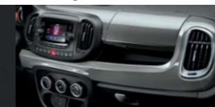
612 Grigio Maestro