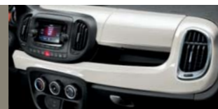
268 Bianco Gelato