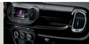
601 Nero Cinema