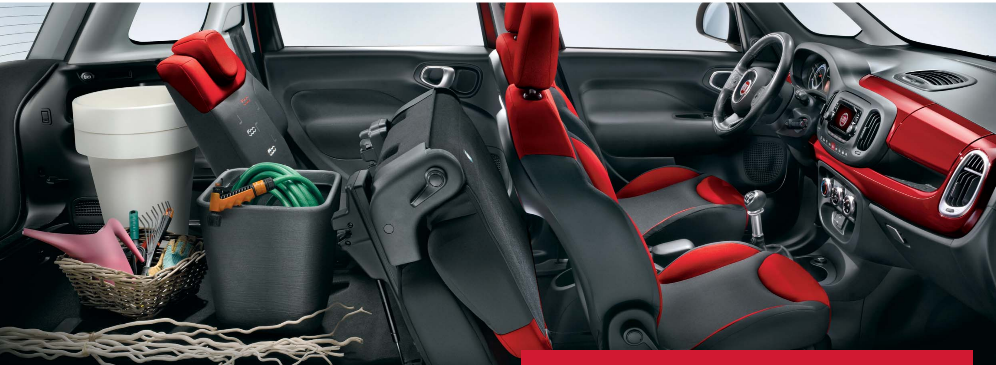
Interno con sedili con funzione fold&tumble che permettono di ottenere un piano di carico piatto che sfrutta l'intera lunghezza del veicolo.

500L PRO è generosa di spazio, di comfort, di praticità, perché tutto è studiato per ottenere il massimo rendimento con il minimo sforzo. La plancia ergonomica, dispone di numerosi vani portaoggetti per avere tutto sempre a portata di mano. Due di questi sono dotati di sportello di chiusura. La strumentazione è ad alta leggibilità e integra la radio UConnect™ con display "touch" da 5 pollici. Ma a bordo c'è sempre un posto riservato alla classe, grazie agli interni disponibili nei raffinati colori grigio/nero o decisi grigio/rosso.