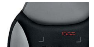
Tessuto Star Grigio/Nero