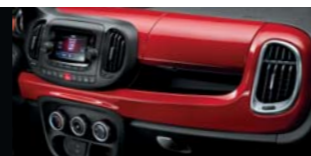
111 Rosso Passione